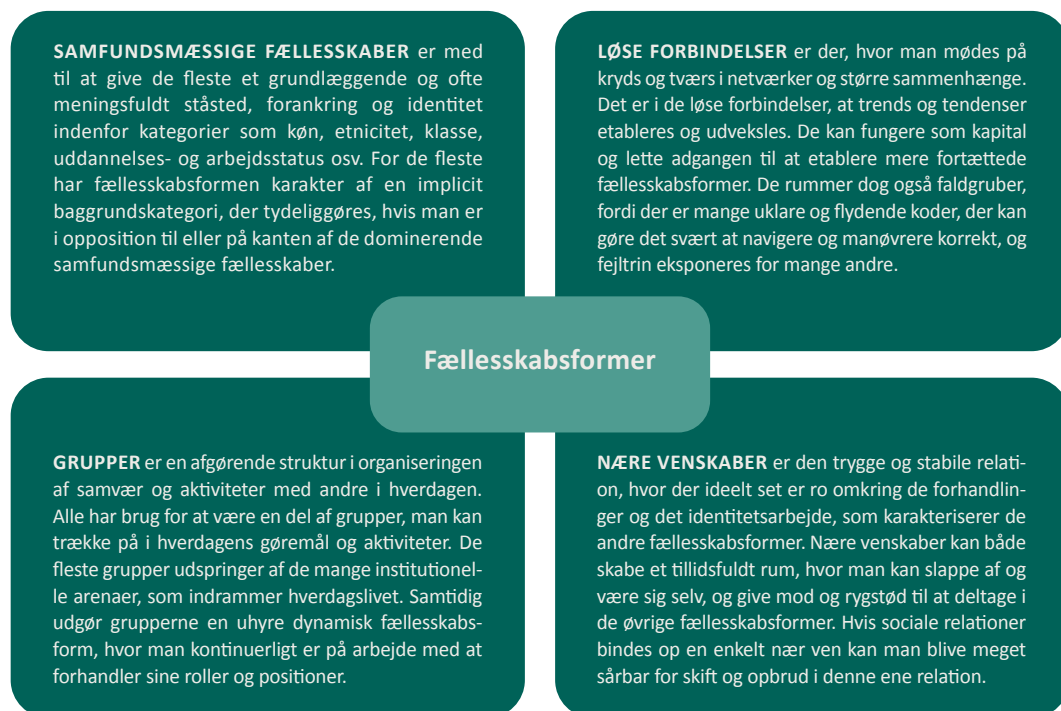
Figur 3. Fællesskabsformer i ungdomslivet

Det lægger med afsæt i Bruselius-Jensen et al (2023) op til en differentiering mellem de forskellige former for fællesskaber – 'samfundsmæssige fællesskaber', 'løse forbindelser', 'grupper' og 'nære venskaber' – der fylder og er tilbøjelige til at virke ind på unge og deres liv på forskellige måder. Det illustreres i figur 3