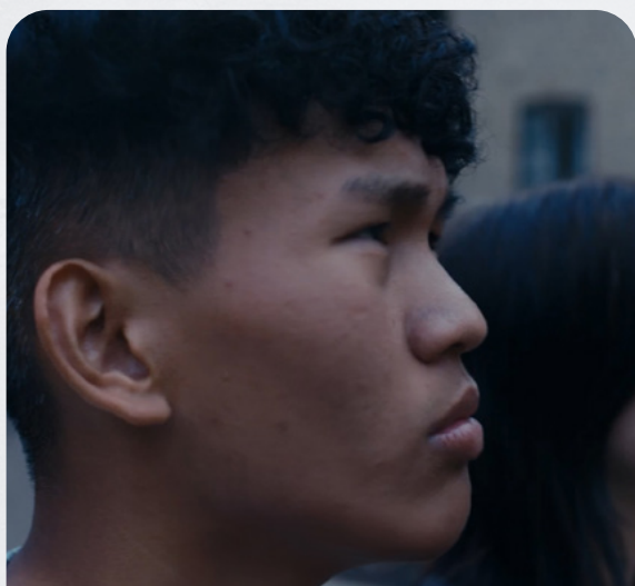
Eleverne stillede sig modigt foran kameraet til de historiske film.

Til den første workshop med 10. klasse arbejdede eleverne, generelt betragtet, fokuseret, og de havde mange gode ideer til, hvordan Fattiggårdens skæbner kunne formidles til andre unge. Det var tydeligt, at eleverne havde et særligt blik for og interesse i at forklare, hvorfor fortidens skæbner handlede, som de gjorde. Eleverne var ikke blot beskrivende i deres tilgang, men analyserende og reflekterende. Det blev dog også allerede her klart, at eleverne faktisk var