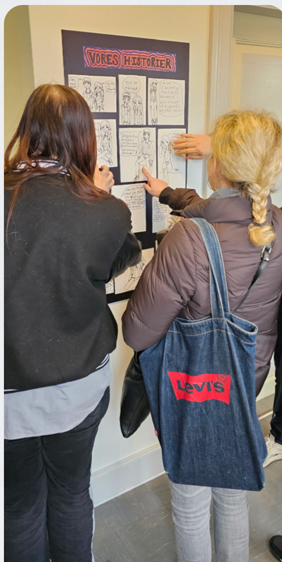
Plancher nærstuderer af eleverne til femiseringen af deres fælles udstilling.

"Det har fungeret godt, at vores elever har skullet arbejde med de historiske skæbner. De har hermed kunnet tage afsæt i noget allerede eksisterende og har virkelig haft mulighed for at lære meddigtningens kunst med god hjælp fra forfatter og tegner. De har undervejs været kritiske i forhold til det, de selv har produceret, men meget begejstrede over det, klassekammeraterne har lavet. Alle er MEGET tilfredse med deres færdige tegninger. Der har i hele processen været