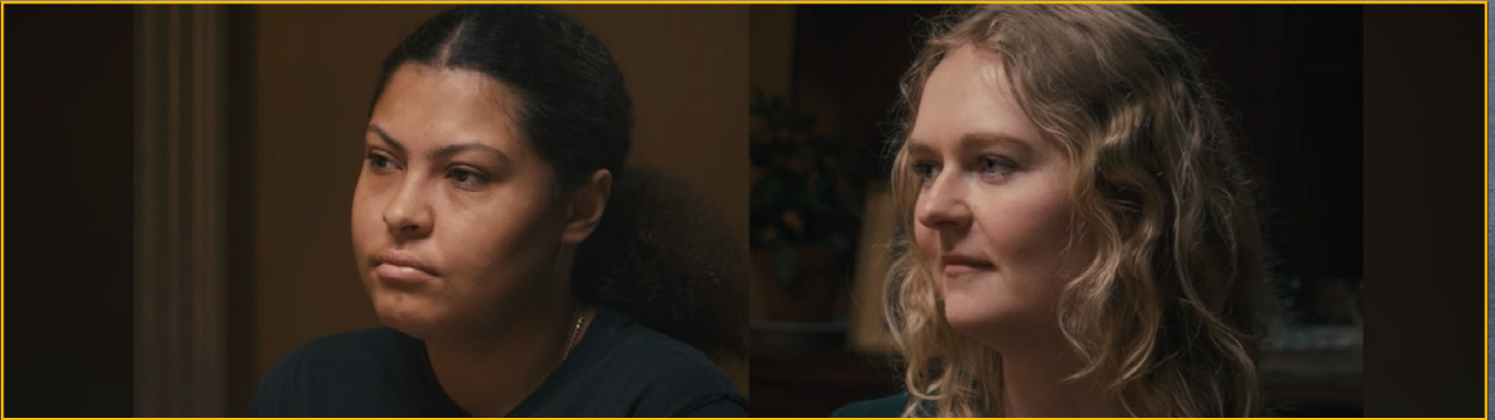
Unge uden anbringelseserfaringer lyttede opmærksomt til de andre unges fortællinger om at det være ung og anbragt uden for hjemmet.