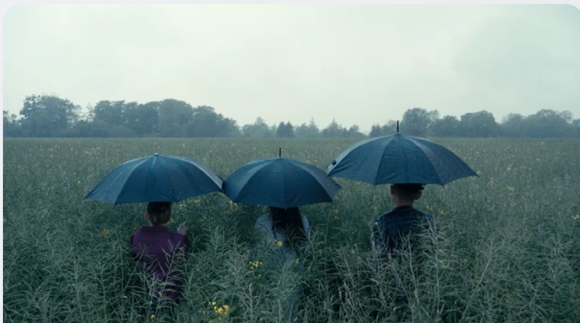
Stemmingsbillede fra den historiske film om Holger.

Tre elever har lavet kunst. Den ene har lavet sin egen tegneserieplakat, hvor hun sammen