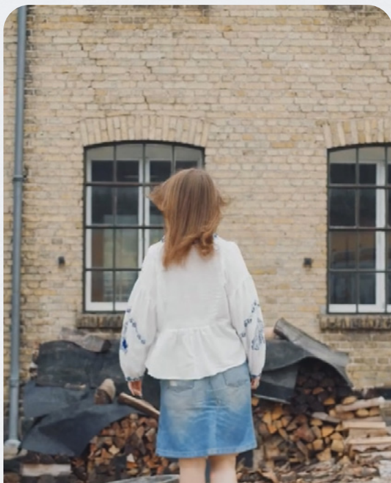
De unge filmede i Fattiggårdens autentiske miljøer til de historiske film.

om dem selv som "problematiske" og/eller "byrder" for andre i kraft af, at mange gennem flere år har været i kontakt med forskellige sociale myndigheder og har oplevet udfordringer i skole og/eller hjem.