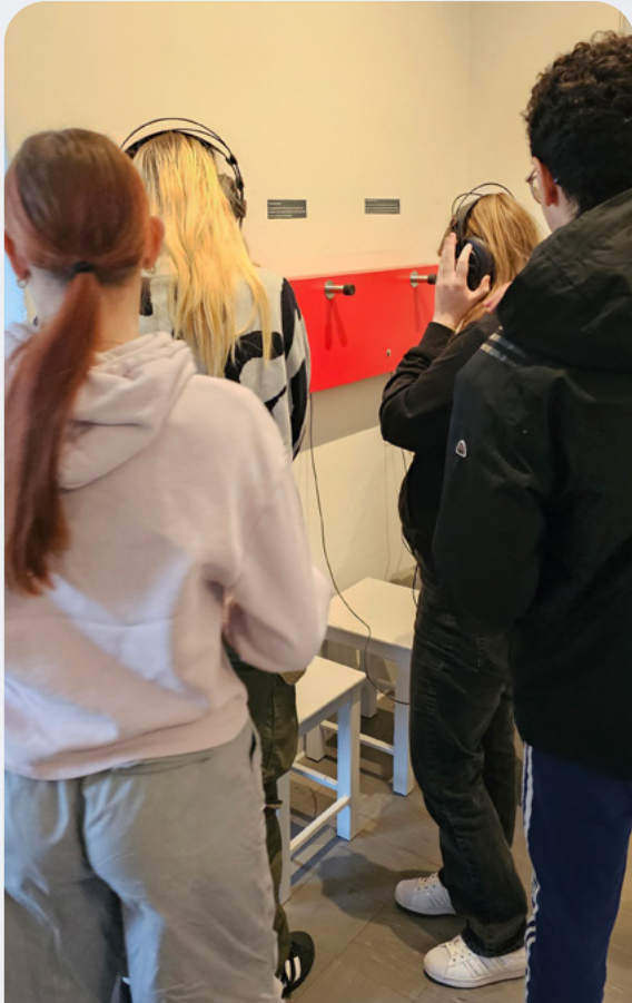
Der lyttes til de andres elevers podcasts i udstillingen.

en stærk kriger. Dette glemmer jeg aldrig, og ord tager jeg ikke for givet."