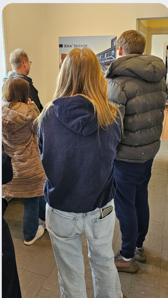
Klassekammeraternes fortællinger læses grundigt.

”Det betyder virkelig meget, at samarbejdet med museet fører til, at der er noget konkret, der bliver ført ud i livet – at man fx kan se filmene osv. Så føler man, at man er blevet taget alvorligt, og at der er blevet handlet på det, man har sagt. Det viser en tillid fra museets side af og det viser: ’Okay de har hørt hvad jeg har sagt, og jeg får lov til at få en stemme, som går videre ud i verden.’”